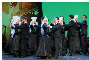
Ljubljana z okolico

http://www.facebook.com/photo.php?fbid=10150143711743018&set=a.10150143710958018.340898.63684903017&type=3&permPage=1 (14. 12. 2012).